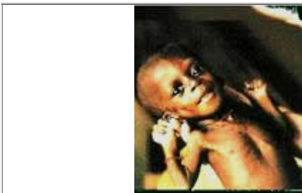
乍得一个极度缺乏营养的儿童