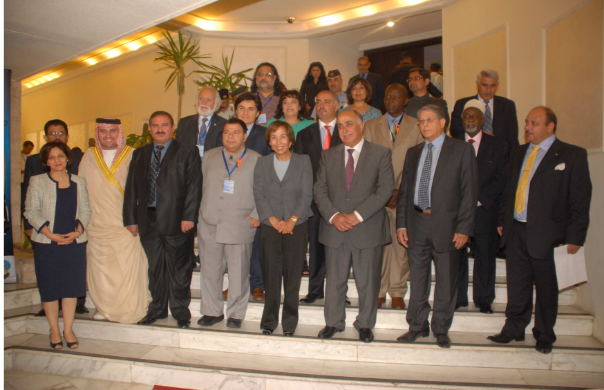
صورة رسمية للمنظمة يظهر في وسطها: معالي ريميجيو مارادونا الأمين العام لـ(امسام) وسمو الأميرة بسمة بنت طلال - عمان، الأردن