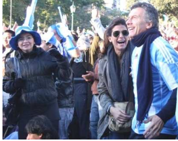
موريشيو ماكري/ رئيس بلدية بوليفيانو